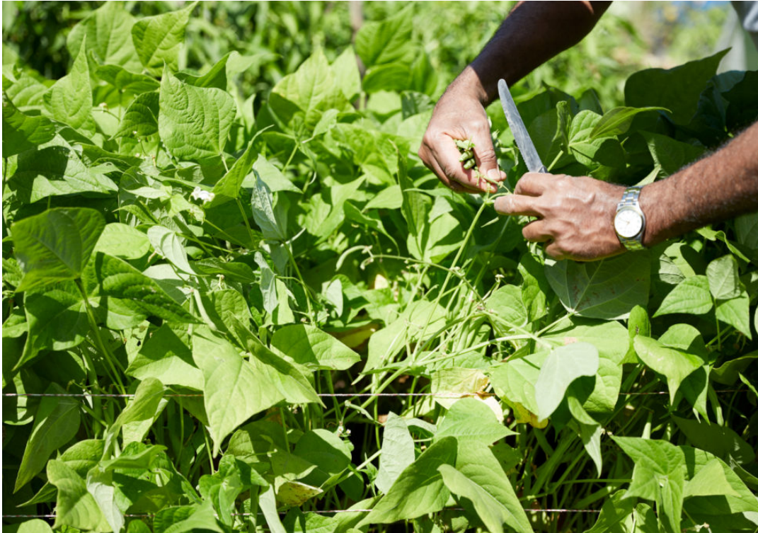
Chilis wachsen auch hier, im Schrebergarten. Neben Okra, den Ladyfingern, neben Bittermelonen, Auberginen, Tomaten, Süsskartoffeln, Bockshornklee, neben Indischer Pfefferminze, neben Brahmi, dem kleinen Fettblatt, mit dem sie manchmal ayurvedisch kochen. Geschichte Okra