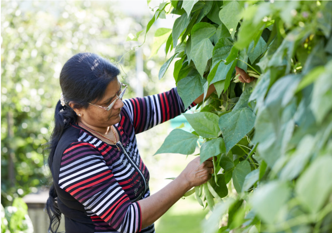
«Das Arbeiten im Garten befreit den Kopf und ermöglicht es uns, dass wir gesundes Gemüse ohne Chemie essen können.» Geschichte Okra