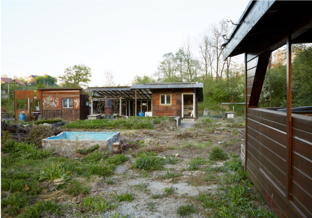
1961 übernahm Rösli Stöckli die Gartenparzelle zusammen mit ihrem Mann. Ein grünes Fleckchen Erde, das zum Rückzugsort wurde.