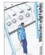
Selina Ursprung Waschen und Falten edition clandestin, 96 S.